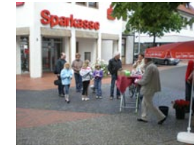
03. Juni- Mit 230 Rosen auf dem Wochenmarkt