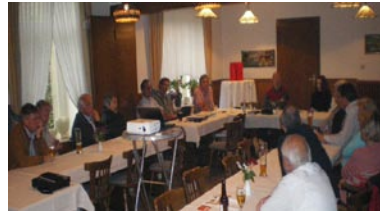
15. Juni- SPD im Dialog „Klimagemeinde Westerkappeln“