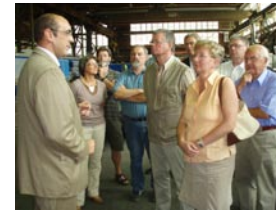
4. August- Besuch bei der Firma Möller GmbH/ VAT