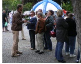
03. Mai- Mit 400 Rosen auf dem Maimarkt