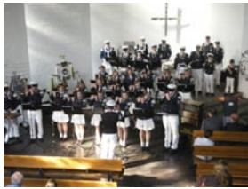
26. Juni- Übergabe des Erich-Schröder-Preis an den Spielmanszug Velpe