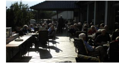
22. Juni- Grillen beim Sommerfest des Männerkreises Velpe