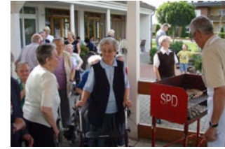
26. Mai- Mit dem Roten Grill am Haus der Diakonie