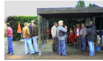
20. Juni- Mit dem Roten Grill an der Timpenstrasse