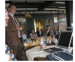
02. Juni- SPD im Dialog „Haltepunkt Velpe“