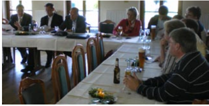
04. April- SPD im Dialog „Jugend- arbeit in Sportvereinen“