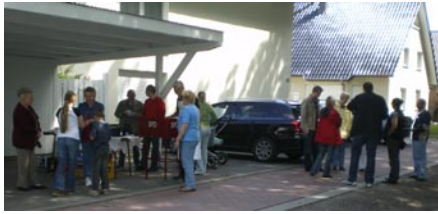
13. Juni- Mit dem Roten Grill an der Erich-Schröder-Strasse