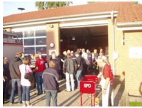
20. Juli - Mit dem Roten Grill am Feuerwehr Gerätehaus Velpe