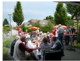
01. August- Mit dem Roten Grill in der von-Loen-Strasse